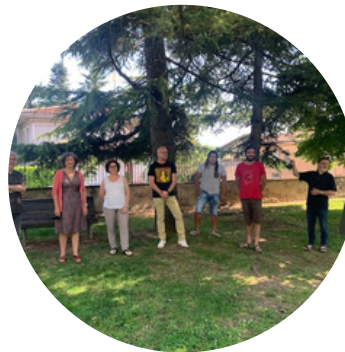
Xavier Roviró i Alemany Alcalde de Folgueroles

Podeu conèixer en tot moment les actuacions del consistori a través de la web municipal i a partir de l'aprovació del PAM conèixer en tot moment el grau de consecució dels nostres projecte. Així com conèixer el Pla de Mandat del nostre equip per aquesta legislatura.